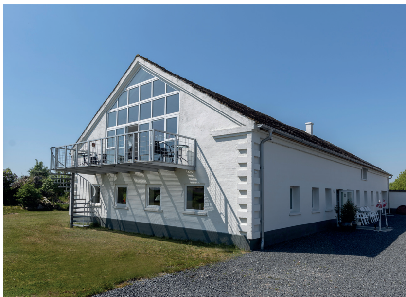
Galleri Knadring - Langager på Helnæs